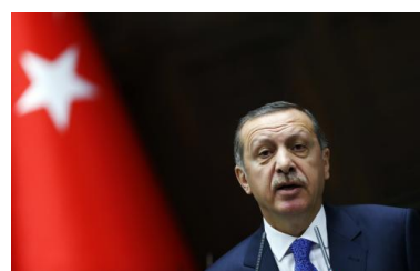
Depuis le coup d'État raté de juillet 2016, le président turc Recep Tayyip Erdogan a lancé une purge massive visant les membres et sympathisants de la confrérie Gülen, qui fut l'un de ses principaux alliés dans la conquête du pouvoir

Cette surveillance clandestine de la diaspora turque, entamée fin septembre 2016, a touché au moins 38 pays sur tous les continents. Une bonne moitié des pays de l'Union européenne est concernée : la Belgique, les Pays-Bas, l'Allemagne en ses différents Länder, la Grande-Bretagne, la Suède, la Finlande et la Norvège, le Danemark, la Suisse, l'Italie, la Pologne, la Roumanie et la Bulgarie. L'opération a également été menée en Asie centrale, en Afrique, en Arabie saoudite, jusqu'en Australie et au Japon. On ignore si la France a été visée, aucun rapport concernant notre pays ne figurant dans nos données.