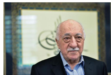
Fethullah Gülen, âgé de 75 ans, dirige sa puissante confrérie depuis les États-Unis. Le président Erdogan a demandé, sans succès, au gouvernement américain de l'extrader

L'existence de cette campagne d'espionnage a été confirmée par plusieurs procédures judiciaires. Le 15 février dernier, la police allemande a perquisitionné les appartements de quatre imams turcs suspectés d'avoir espionné des gülenistes pour le compte du consulat turc de Cologne. Les services du procureur fédéral ont confirmé qu'ils étaient suspectés d'avoir agi sur la base de la lettre distribuée par le Diyanet le 20 septembre.