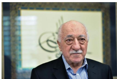
Fethullah Gülen, âgé de 75 ans, dirige sa puissante confrérie depuis les Etats-Unis. Le président Erdogan a demandé, sans succès, au gouvernement américain de l'extrader.